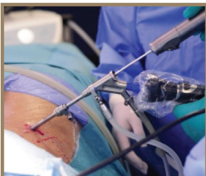
એન્ડોસ્કોપીક સ્પાઇન સર્જરી

લેટેસ્ટ ઈક્વિપમેન્ટ્સ દ્વારા ઓપરેશન વગર અથવા નાના ચીરાવાળા ઓપરેશનથી સુરક્ષીત અને ફાયદાકારક સારવાર.