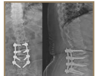
લમ્બર સ્પાઇન ફિક્સેશન